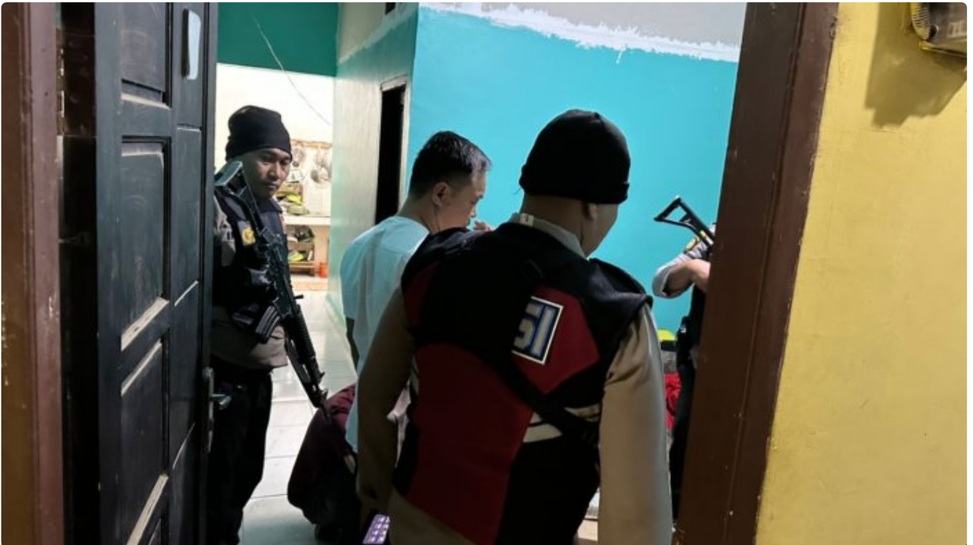
Tampak aparat kepolisian Morowali lakukan razia

MOROWALI, Sulawesi Tengah- Kepolisian Resort (Polres) Morowali tidak Panas Panas Tai Ayam, merespon cepat dan menindak tegas keluhan dari para tokoh masyarakat terkait peredaran Minuman Keras (Miras) yang selama ini cukup meresahkan di wilayah kecamatan Bahodopi, Kabupaten Morowali.